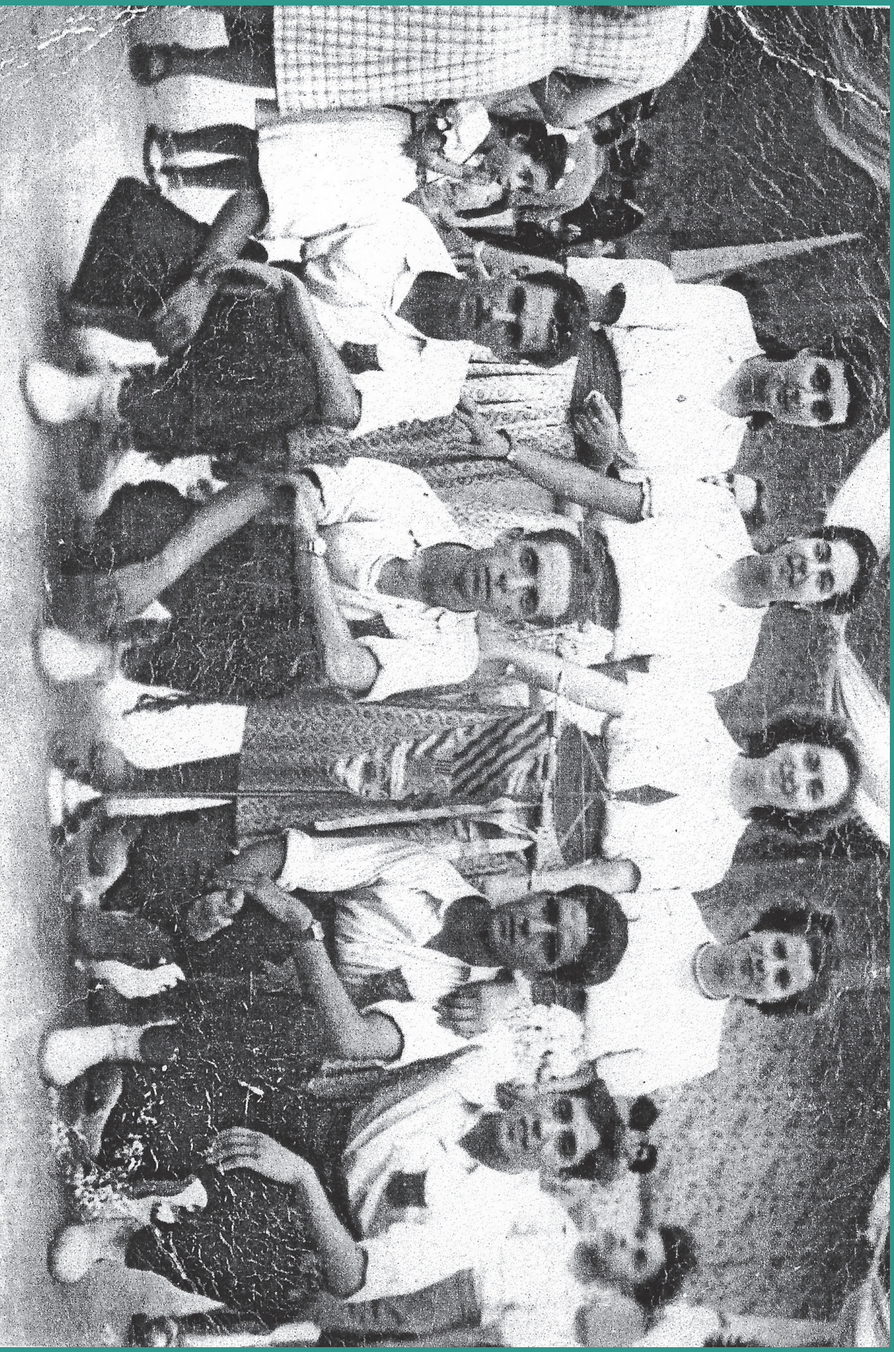
Grup Sardanista de Móra la Nova, anys 50.