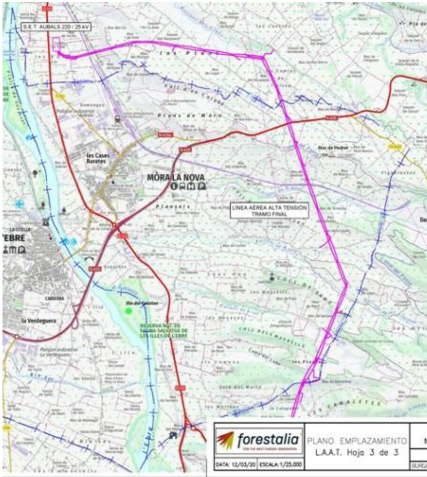
Línies d'evacuació parc eòlic de Muntanyes de Burgans 1